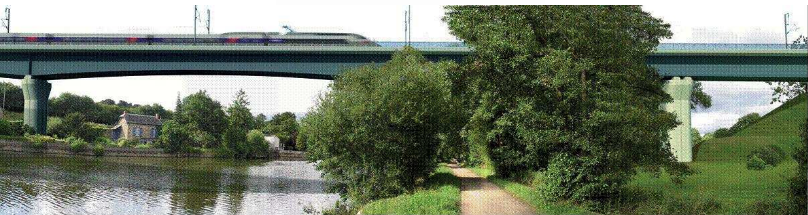
Viaduc de la Mayenne