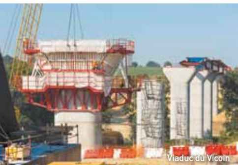
Viaduc du Vicoin

Plus modestes, les viaducs de la LGV Bretagne-Pays de la Loire n'en sont pas moins construits avec ces mêmes matériaux. « Pour leurs réalisations, la société Eiffage Travaux Publics, spécialisée dans la maîtrise du béton, s'est associée avec Eiffage Construction Métallique. Ce savoir-faire béton et métal nous permet de proposer des solutions innovantes pour la réalisation de certains ouvrages d'art. C'est le cas sur ce chantier LGV où, pour la première fois en France, nous réalisons des viaducs bipoutres mixtes à hourdis inférieur collaborants. » Une technique qui permet d'affiner encore la taille des poutres du tablier, en réduisant l'utilisation du métal de 15 à 20% : une optimisation intéressante en matière de développement durable.