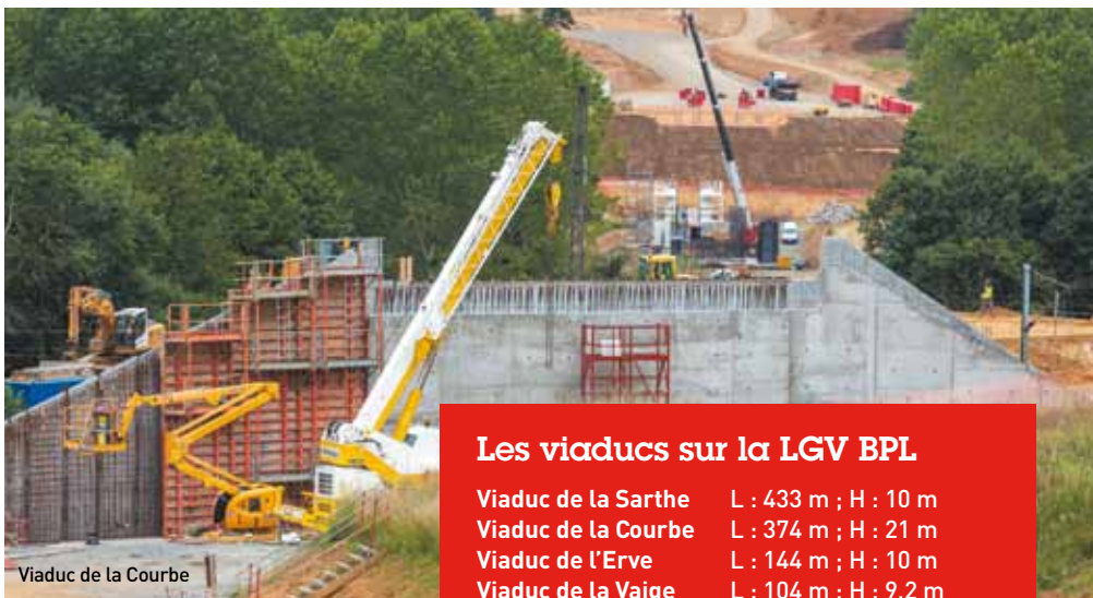
Viaduc de la Courbe