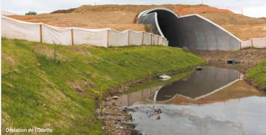
Déviations de l'Ouette

Le TOARC D, tronçon de travaux situé entre Louverné et Ballée, tient ses promesses en matière de calendrier.